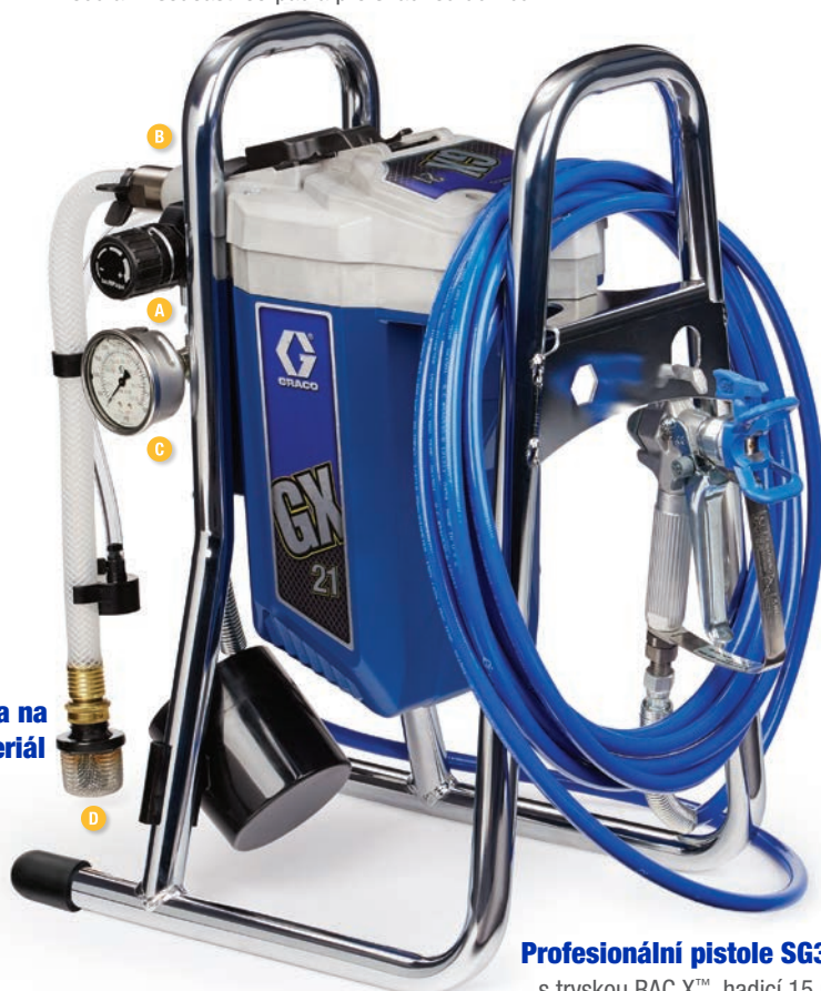
Profesionální pistole SG3™ s tryskou RAC X™, hadicí 15 m.